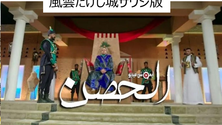
風雲たけし城サウジ版