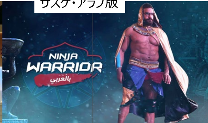
サスケ・アラブ版